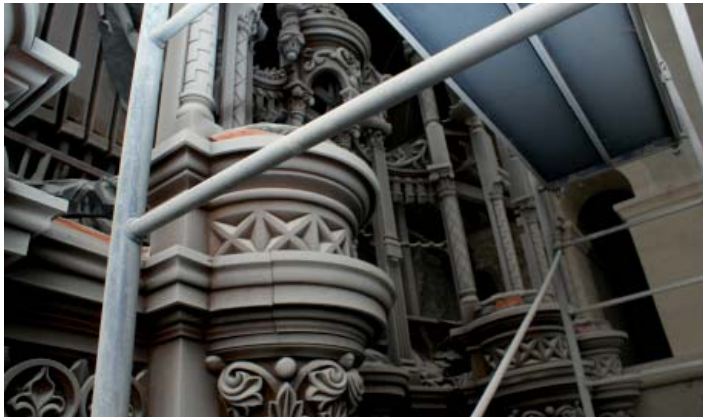
Buffet d'orgue de l'église Saint Joseph