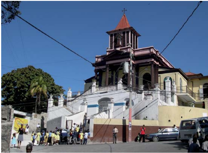
L'église Saint Antoine à Port-au-Prince ... après le séisme